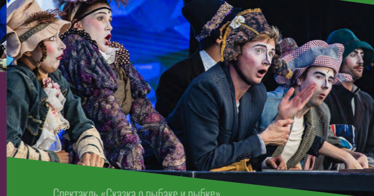
Спектакль «Сказка о рыбаке и рыбке», Театр — Сцена «Мельников»