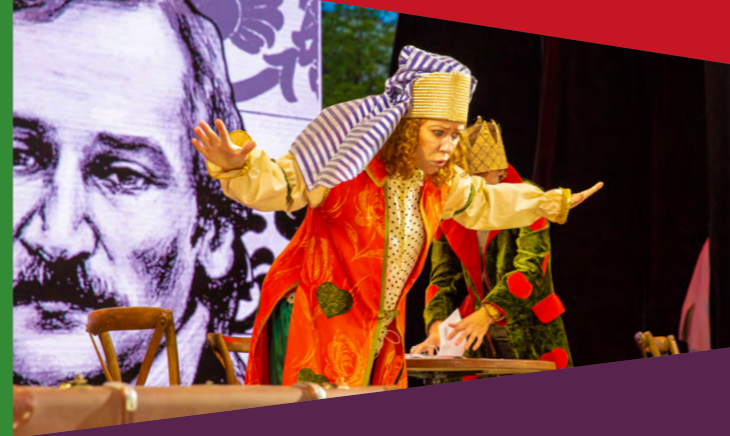
Спектакль «Про Федота-стрельца», театральный салон «Студия 23»

Спектакль-мюзикл «Летучий корабль» Театр Российской Армии